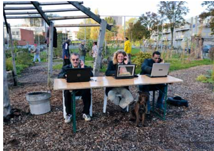
Kantoor op de Afrikaandertuin

Op de Gemeenschapstuin was het ooit de bedoeling dat er een buurtserviceteam met onder meer werkloze wijkbewoners gevormd zou worden dat het onderhoud ging doen. Zo'n team met wijkbewoners tewerkgesteld in de eigen wijk is intussen een uitermate slecht idee gebleken. Het bedrijf SDW ontdekte dat het veel beter is