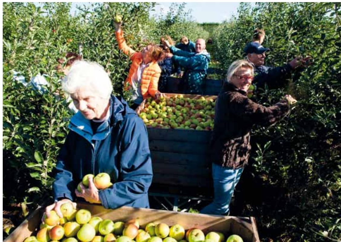
Appeloogst op de Buytenhof

Op vrijwel alle Rotterdamse buurttuinen zijn mensen met een niet-Nederlandse achtergrond actief. Met de Tuin aan de Maas als enige uitzondering. Mensen met een niet-Nederlandse culturele achtergrond zijn nu eenmaal dun gezaaid op de Müllerpier. Overigens komen er wel eens mensen uit Schiedamse Oogst op. Dat mag, al wordt er wel bij gezegd dat het dan wel min of meer de bedoeling is dat men wat terug doet voor de tuin. En ook dat gebeurt. In het Schiebroekse stadslandbouwproject nemen