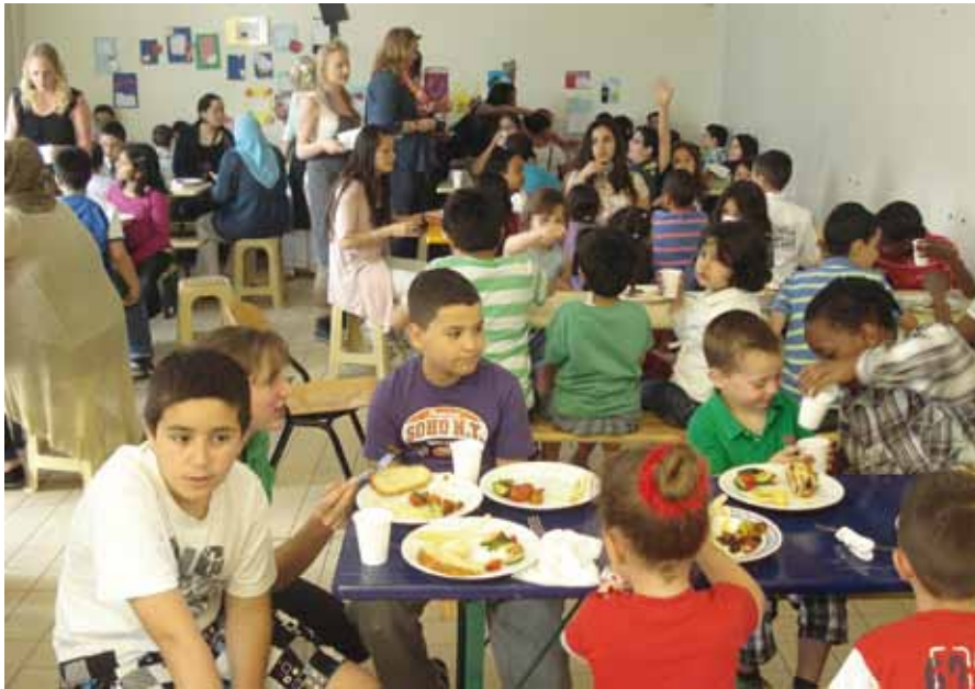
Samen eten op OBS Bloemhof