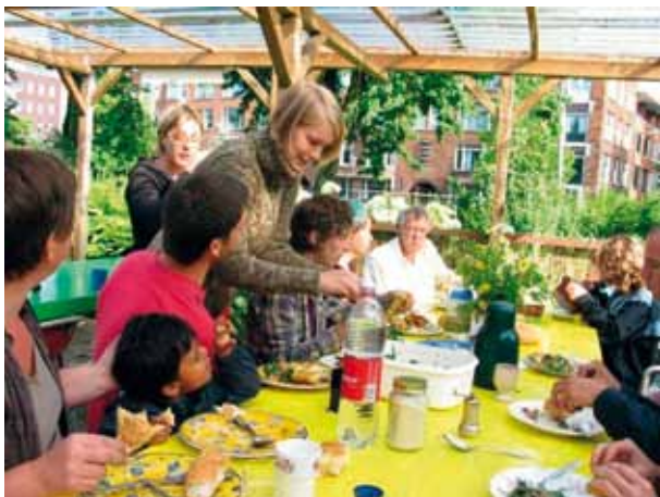
Samen eten op de Gandhituin

Als de start lukt gaat de rest wel overal zo goed als vanzelf.