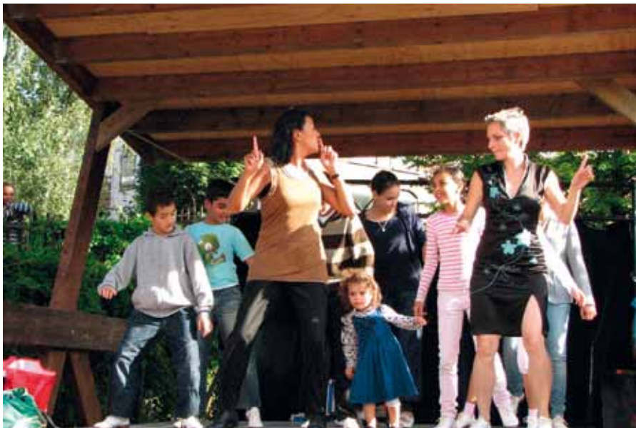
Tapdance workshop op de Tussentuin

Er zijn een paar initiatieven waar gezondheid wel een expliciet doel is. Bijvoorbeeld bij de Voedseltuif . Daar is het streven immers de klanten van de Voedselbank verse en dus gezonde groenten en fruit aan te bieden.