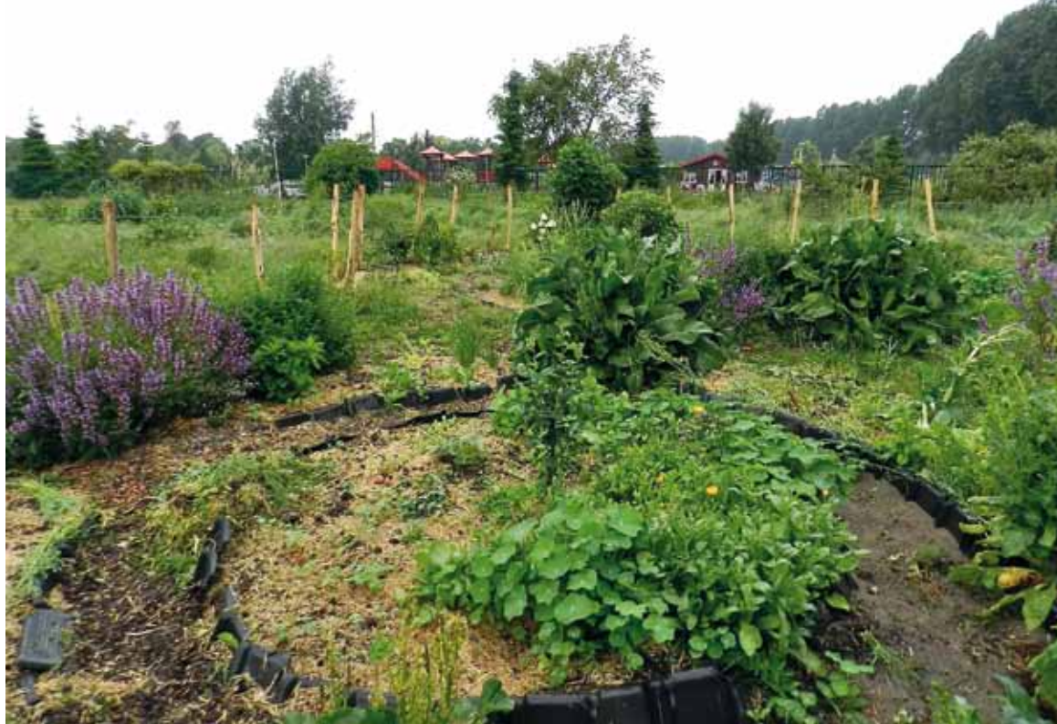
Permacultuur kruidenspiraal Wollenfoppengroen & co

afbreken van bepaalde afvalstoffen. Permacultuursystemen kunnen ook bescherming bieden tegen (...) wind en water.