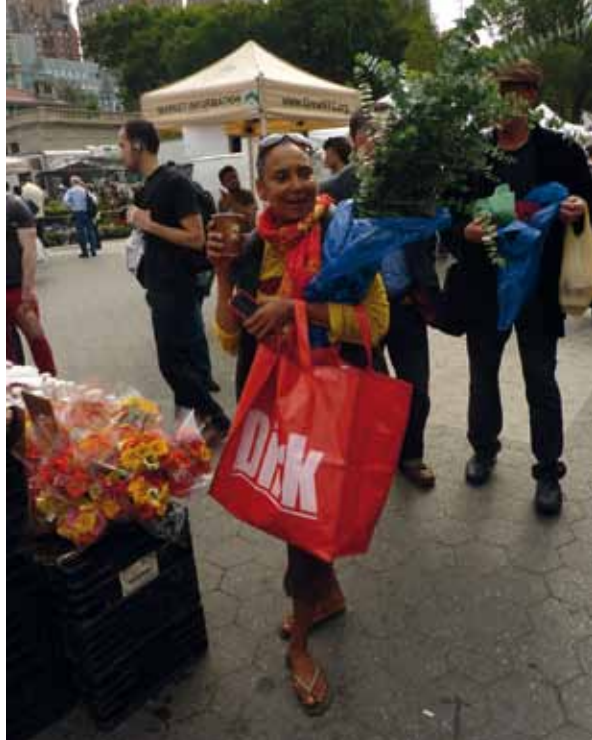
Surinaamse dame op boerenmarkt, Union Square, New York City

Een van de problemen is de betaalbaarheid van de lokaal geproduceerde producten. 89 Er zijn drie groepen te onderscheiden: de reeds overtuigden , die zich duurder voedsel ook kunnen veroorloven; degenen die nog overtuigd moeten worden en de mensen die het zich niet kunnen veroorloven om op bio- en boerenmarkten inkopen te doen. In de VS is voor die laatste categorie een systeem bedacht waardoor mensen die de zogenaamde foodstamps gebruiken het recht hebben om op boerenmarkten extra voordelig in te kopen. 90 Het zou te overwegen zijn om via een vergelijkbare regeling – bijvoorbeeld via de Rotterdampas - de Rotterdamse bio- en boerenmarkten voor uitkeringsgerechtigden en andere minder kapitaalkrachtige Rotterdammers toegankelijker te maken. De belangrijkste reden om geen duurzaam geproduceerd voedsel te kopen is vaak de prijs, zo blijkt uit onderzoek. 91