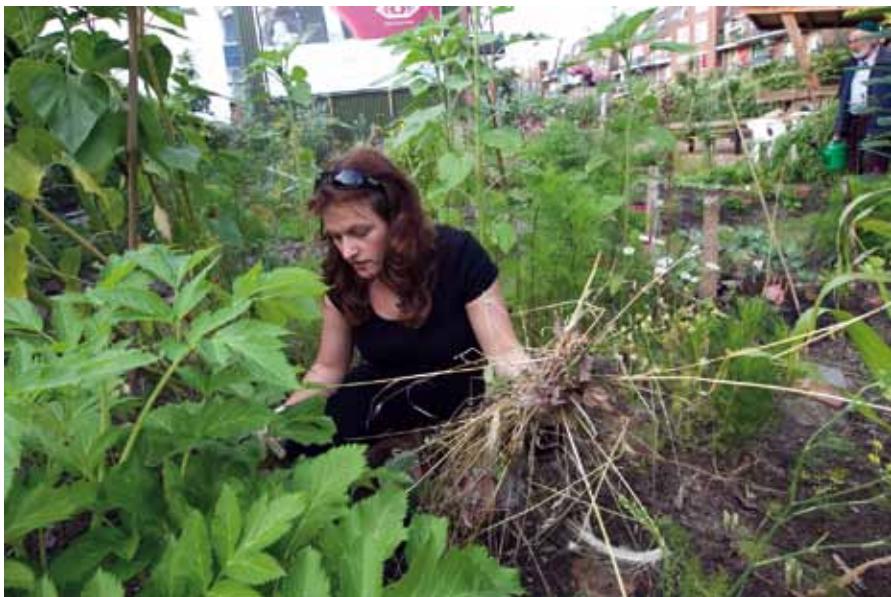
Vrijwilligster op de Tussentuin